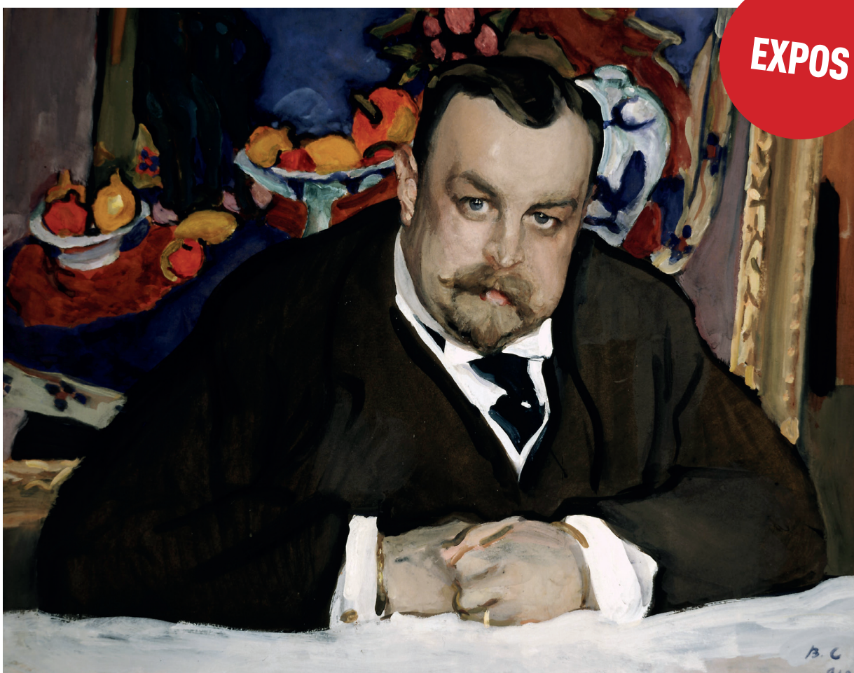
Valentin Serov, Portrait du collectionneur Ivan Abramovitch Morozov , 1910, tempera sur carton, 63 x 77 cm.

À l'instar de la collection Morozov à la Fondation Louis Vuitton, longtemps différée en raison de la crise sanitaire, les grandes expositions font leur retour dans les musées. La rédaction du « Journal des Arts » les a visitées pour en rendre compte avec un œil gourmand et critique. PAGES 17 À 25